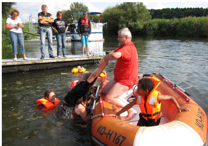
Zu sehen waren viele nützliche Tricks wie man Personen an Bord holt.