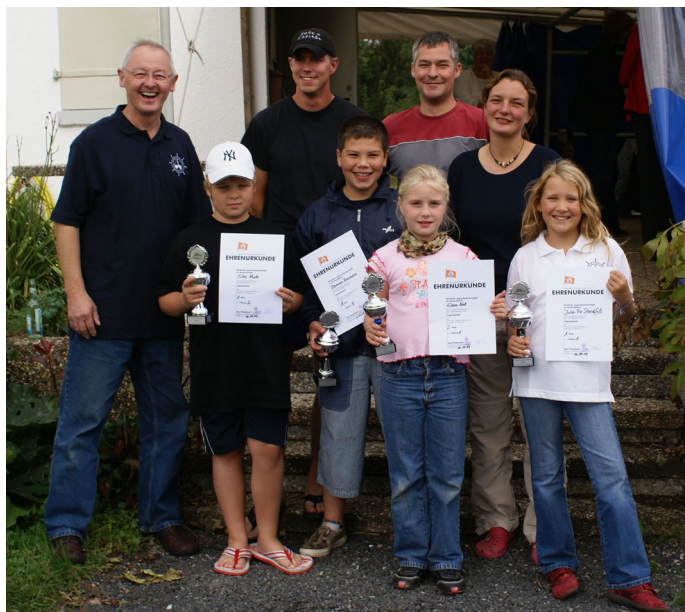
Strahlende Sieger bei den diesjährigen Clubmeisterschaften des BCL

Bei perfektem Wetter konnten wir nicht nur üben, sondern auch in der Lahn schwimmen und viel Spaß haben. Das ist perfekter Sonntagsurlaub!