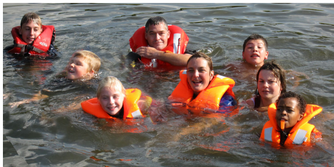
Alle Mann über Bord! Wie schwimmt es sich mit Kleidung und Weste?

Wie kann ich jemanden helfen, an Bord zu kommen? Die Bilder zeigen es: das war mal wieder ein coole Aktion beim BCL. Gemütlich klang der anstrengende Tag dann bei Stockbrot und Stockwürstchen vom Lagerfeuer aus.