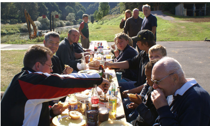
Gemeinsames Frühstück am Börnchen, ein Genuss der besonderen Art.

Fast alle Boote des BCL hatten sich am 29. August auf den Weg zur Scheidter Schleuse gemacht, um eine der letzten Sommernächte an einem der schönsten Plätze an der Lahn, dem Börnchen, zu erleben.