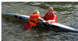
Bergen mit Hilfe eines Surfbretts