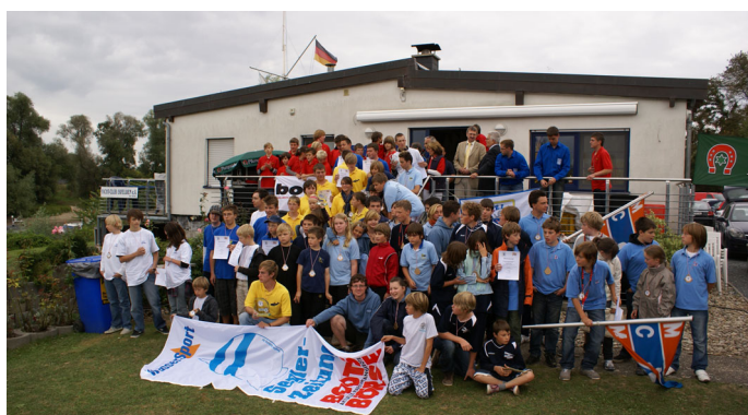
Gruppenbild mit allen Teilnehmer der Meisterschaften in Darmstadt.

Am 12. und 13. September fanden die Hessenmeisterschaften im Jugend-Schlauchboot-Slalom beim Yachtclub Darmstadt in Erfelden statt.