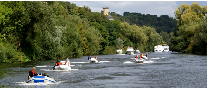
Gemeinsame große Tour der jungen Skipper mit der Lizenz für die Lahn.