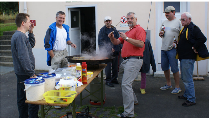
Leckerer vom Grill, köstliche Salate sorgten für beste Stimmung.