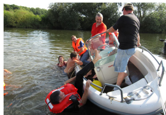
Ins Boot holen bei hohem Freibord

Nächste Vorstandssitzung: 6. Nov. 2009, 19:30 Uhr im Clubhaus des BCL. Anregungen und Wünsche sind immer willkommen!