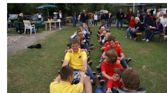
Spaß pur: Alle Mann an die Ruder!