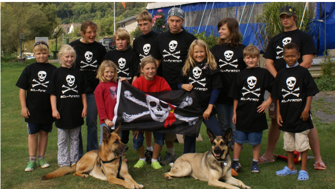
Zum Fürchten? Die fröhlichen Lahn-Piraten vor dem Start ans Börnchen.