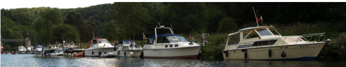
Fast alle Boote des BCL kamen zur Sommernacht ans Börnchen 2009.