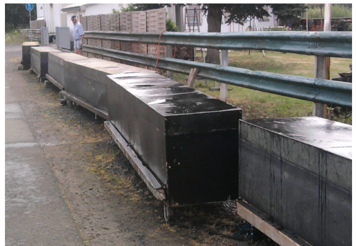
Vor dem neuen Anstrich müssen die Stege gründlich gesäubert werden.

Wer möchte, kann auch wochentags hier an die Arbeit