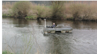
... andere kümmern sich um den Frühjahrsputz auf dem Clubgelände.